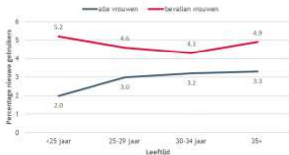
Percentage bevallen vrouwen en vrouwen in de hele populatie (beperkt tot de leeftijdsgroep 15-49 jaar) die starten met antidepressiva, naar leeftijdsgroep (gestandaardiseerd naar leeftijd)

De resultaten tonen aan dat ouders die in de afgelopen 12 maanden een kind kregen, vaker starten met een antidepressivum dan leden uit de hele bevolking . Dat geldt zowel voor moeders als voor vaders. Een bevalling maakt met andere woorden mentaal kwetsbaar.